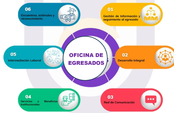
Figura 1. Líneas de Acción