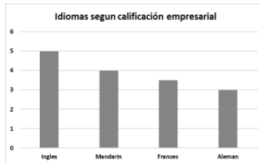
Gráfica 1. Idiomas según promedio de calificación empresarial

Al indagar a través de la herramienta online Mentimeter acerca de las habilidades idiomáticas preferibles en profesionales de negocios, los empresarios respondieron que los idiomas más importantes son el inglés, el mandarín, el francés y el alemán y otros en un menor grado. Según grado de importancia en una escala de calificación de 1 a 5, donde 1 es la calificación más baja y 5 la más alta. Los resultados fueron los representados en la gráfica número 1, donde el inglés obtuvo una calificación mayor y el idioma alemán entre el menos importante.